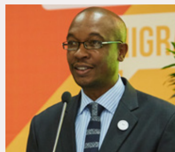
Parks Tau Presidente de CGLU

Los participantes se pusieron de acuerdo sobre los elementos claves de la propuesta para llevar a cabo el desarrollo del Local4Action Hub, que será el foco de la asociación estratégica que se desarrollará con la Agencia Sueca de Cooperación Internacional para el Desarrollo (SIDA, por sus siglas en inglés).