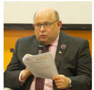
Berry Vrbanovic Alcalde de Kitchener y Tesorero de CGLU

Desarrollamos un plan común en el cual el gobierno nacional era responsable de la integración, el gobierno provincial de la educación, y el gobierno local daba soporte a estos nuevos canadienses que llegaban a las comunidades.