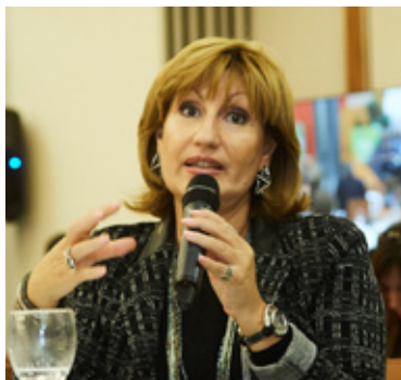
Emilia Saiz Secretaria general de CGLU

Los debates fueron prolíficos y condujeron a resultados que pueden reforzar la estrategia del colectivo: